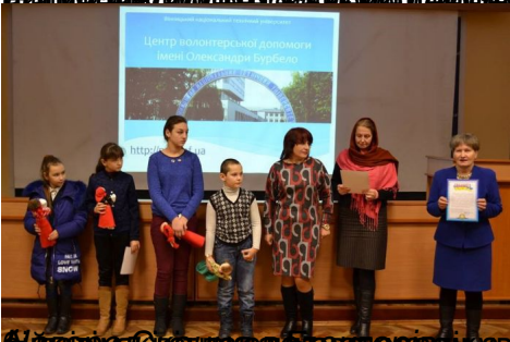
Активісти міжнародного руху відвідали