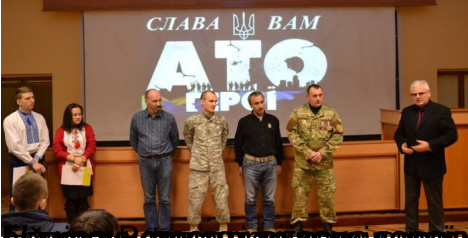
Вісник АТО у День Збройних Сил України та День Волонтера