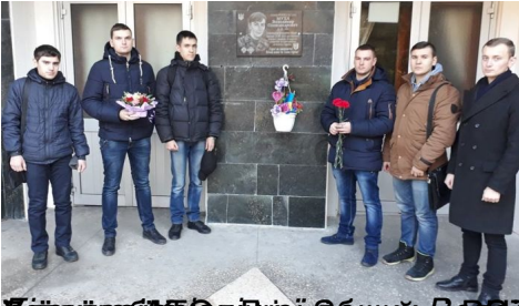
Університетський молодіжний клуб та студентська організація «Молодіжний фронт» у День Волонтера та День Збройних Сил України