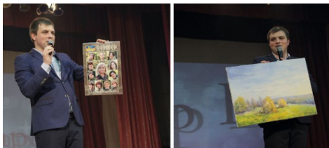
На благодійному аукціоні

Тож, 5 грудня на конкурсі «Містер Шарм ВНТУ» відбувся благодійний аукціон, а виручені на аукціоні кошти підуть на допомогу воїнам АТО та на спорудження пам'ятника студентам і випускникам ВНТУ, які загинули, захищаючи Вітчизну у визвольній війні з російським агресором. На аукціоні вдалося зібрати 1425 грн.