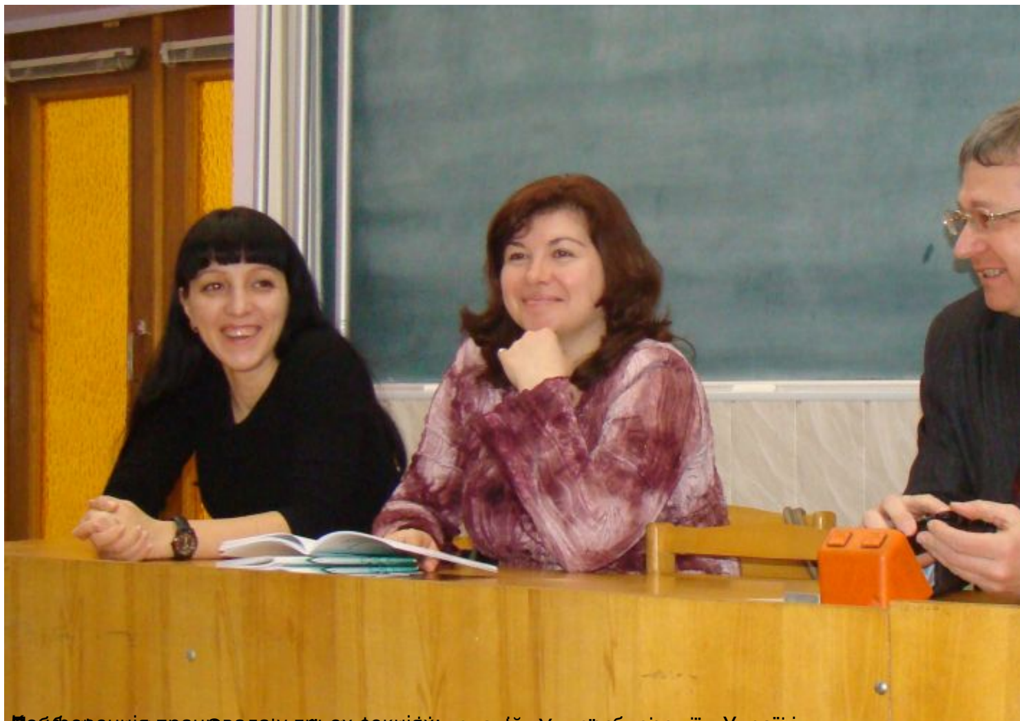
Вибір керівників дослідницьких і інноваційних організацій в Україні;