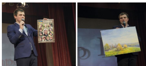
На благодійному аукціоні

Тож, 5 грудня на конкурсі «Містер Шарм ВНТУ» відбувся благодійний аукціон, а виручені на аукціоні кошти підуть на допомогу воїнам АТО та на спорудження пам'ятника студентам і випускникам ВНТУ, які загинули, захищаючи Вітчизну у визвольній війні з російським агресором. На аукціоні вдалося зібрати 1425 грн.