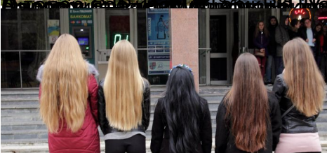
Вітання ректора з нагоди дня народження Рапунцель